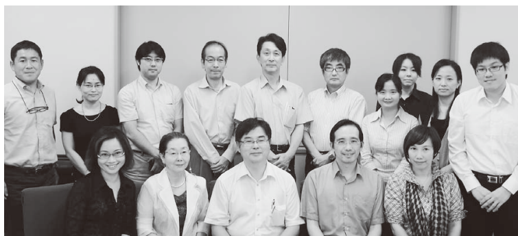
台湾バイオバンクの関係者と、日本の ELSI 委員との交流を終えての記念撮影